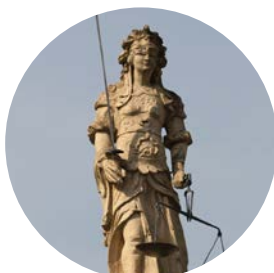
École Doctorale de Droit