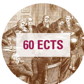
Première année du Master (M1)