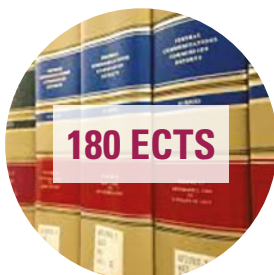
Bachelor en Droit