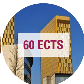
Deuxième année - spécialisations LL.M (M2)

Master en Droit Bancaire et Financier Européen (LL.M.) Master en Droit et Contentieux de l'Union Européenne (LL.M.) Master en Droit Pénal Européen des Affaires (LL.M.) Master en Droit Fiscal Européen et International (LL.M.) Master en Droit des Affaires Européen (LL.M.) Master en Droit de l'Espace, de la Communication et des Médias (LL.M.)